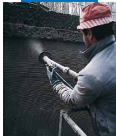
Υδροηλεκτρικό κανάλι Bertini - Robbiate (Como) - Ιταλία: εφαρμογή με ψεκασμό