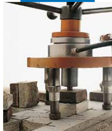
Δοκιμή πρόσφυσης κατά SATTEC